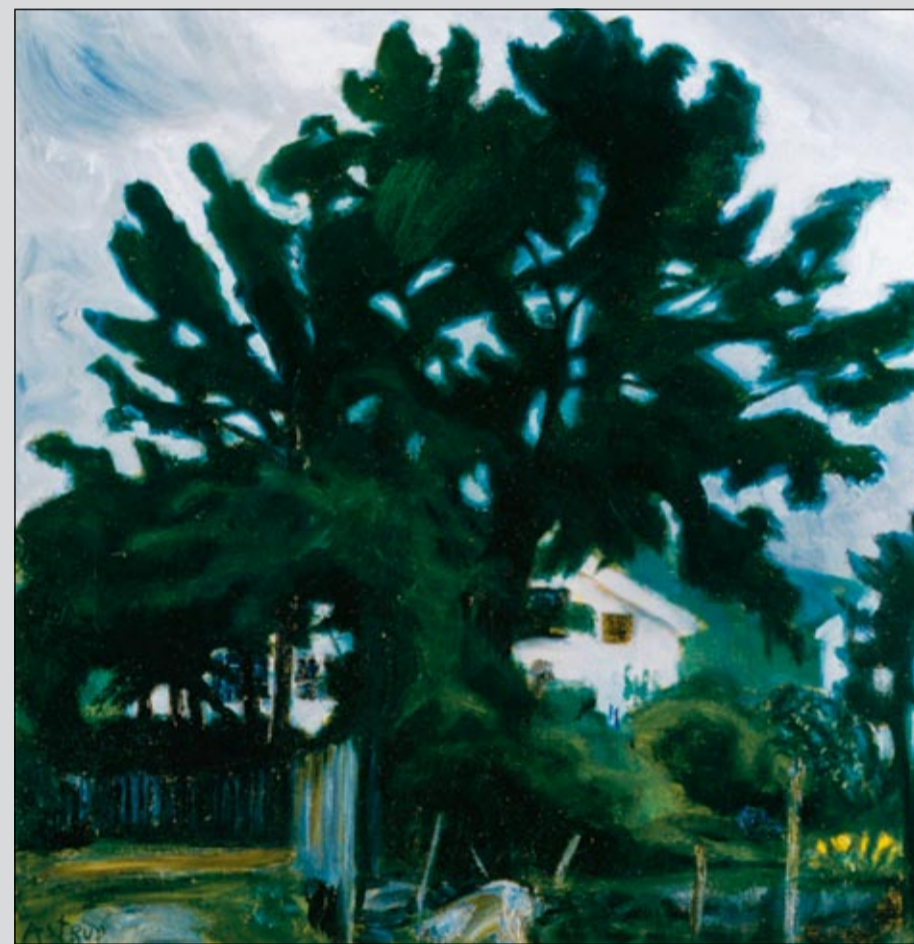
Nikolai Astrup (til h.): Nat. Olie på lærred. Før 1908. DnB Bank Fonden, Bergen.